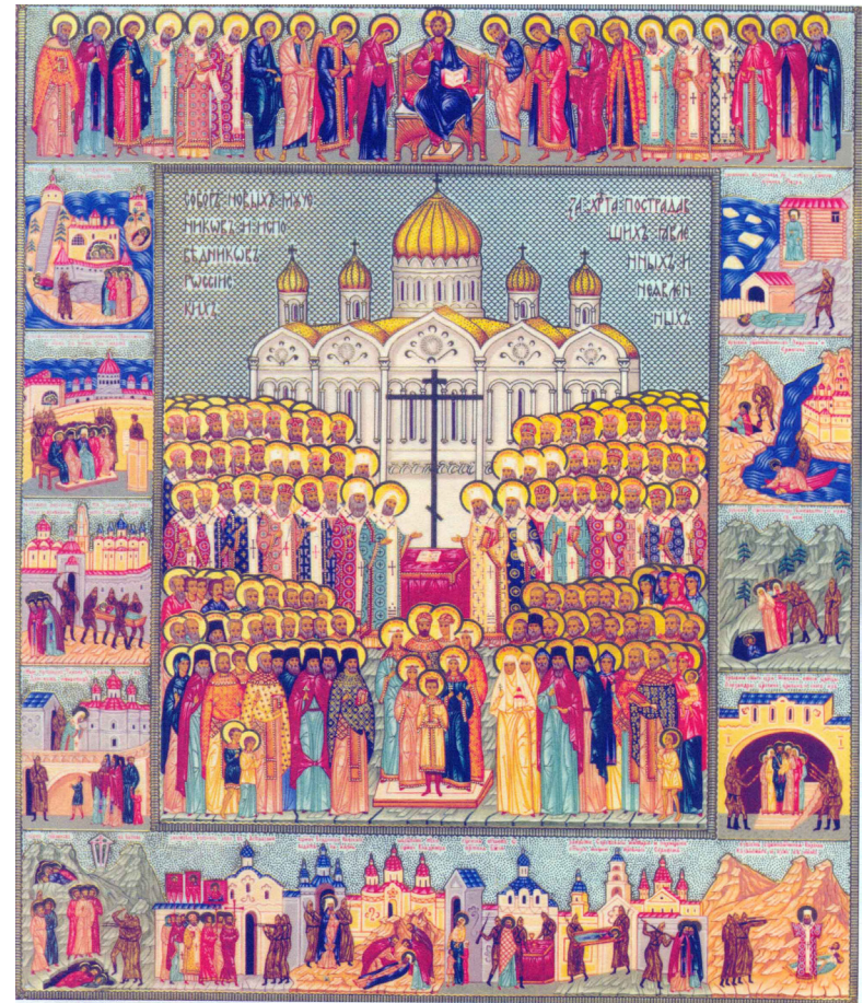
Новомученики и Исповедники Российские. Икона.