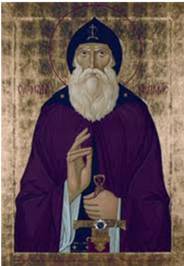
Преподобный Илья Муромец. Икона