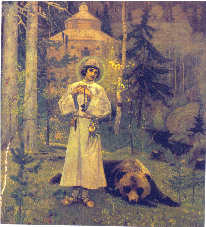
М. В. Нестеров. Юность преподобного Сергия Радонежского