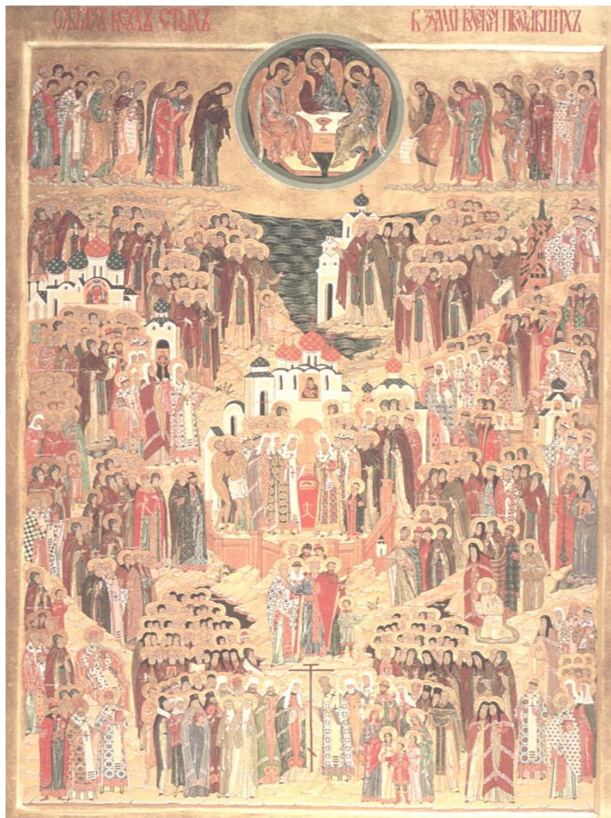
Собор Всех святых, в земле Российской просиявших Икона из Псково-Печерского монастыря